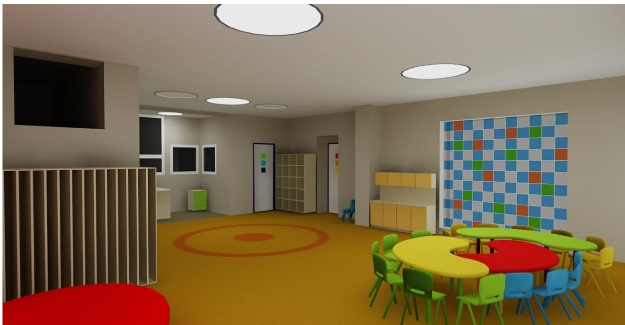
Vizualizace nové třídy v mateřské škole