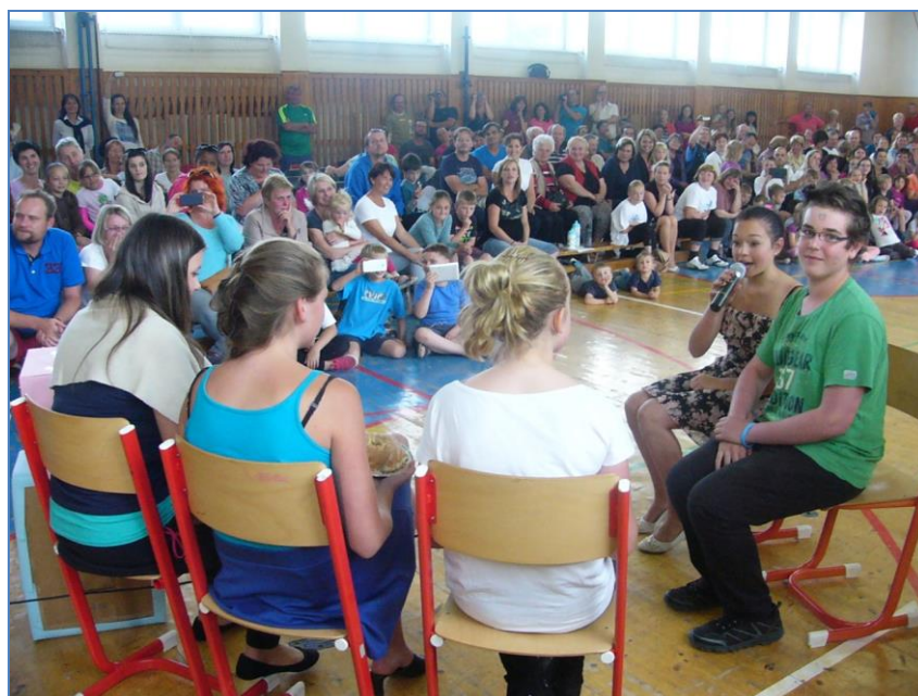
Vystoupení žáků 8.ročníku na školní akademii