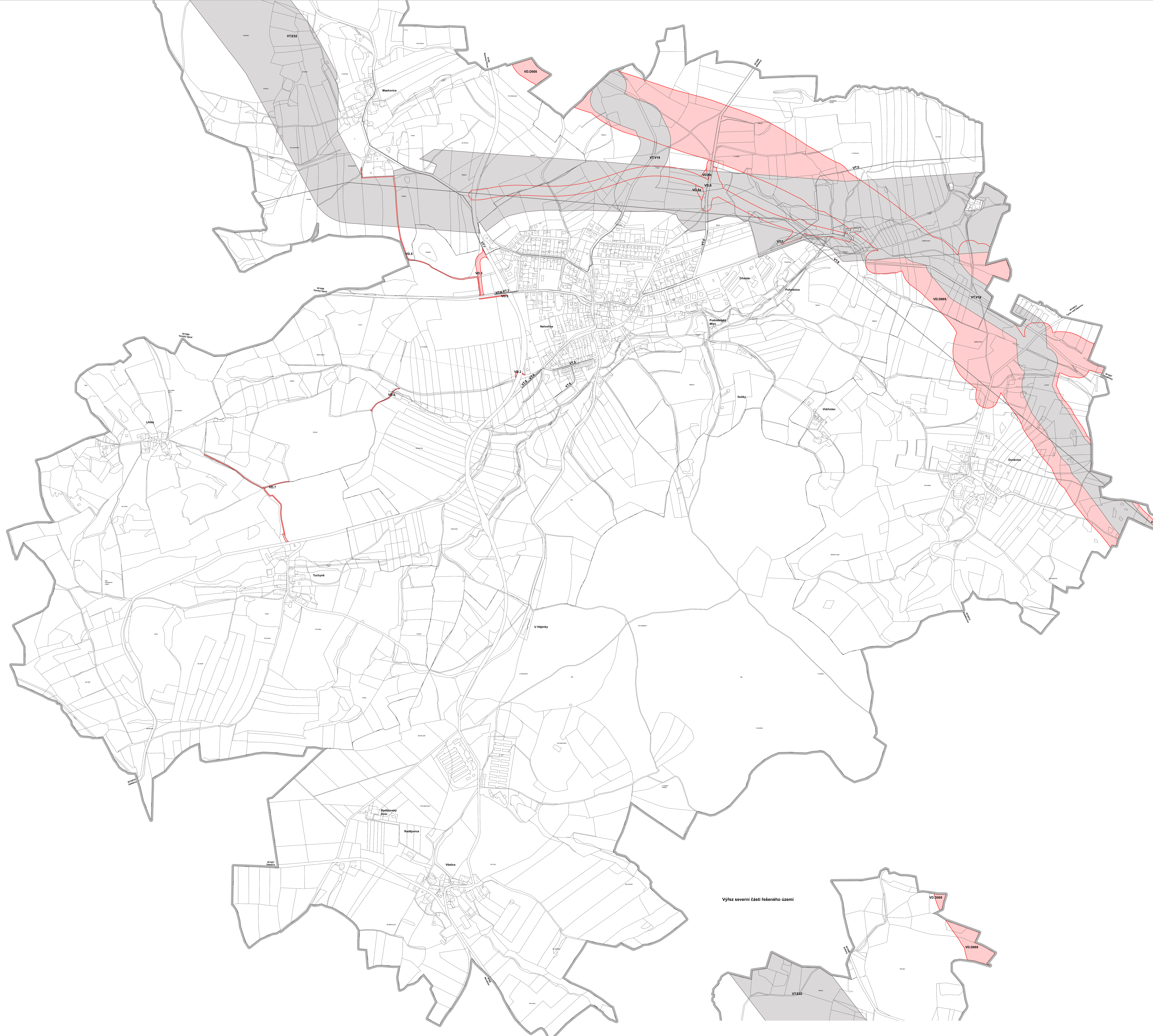
Výřez severní části řešeného území